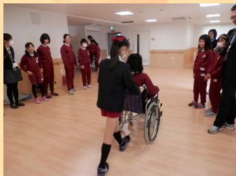
附属小・中学校生徒さんの体験学習