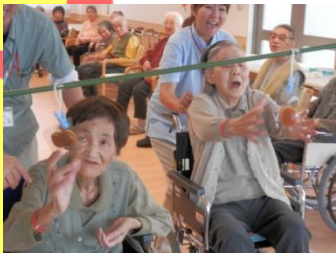
がんばれ～！負けるな～！

玉入れ！大玉送り！パン食い競争！天気は快晴でまさに運動会日和の中、秋の大運動会を開催いたしました。勝負事となると皆様の表情も変わります(笑)いつもに増して手足を大きく動かし一生懸命な姿が大変ほほえましく大いに盛り上がりました。職員も皆様に危険のない様に配慮しながら一緒に楽しく参加させて頂きました。