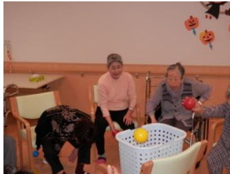
皆さん上手に入れてます♪