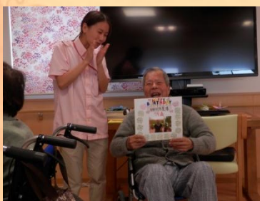
お誕生日会。ハッピーバースデー♪

秋の季節は様々なミニイベントも行いました。紙面の都合で詳しくご紹介できませんが、日常の一コマと題して少しでも雰囲気をお伝えできればと抜粋させて頂きました。