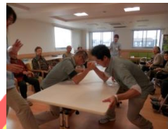
職員も力入りました!!