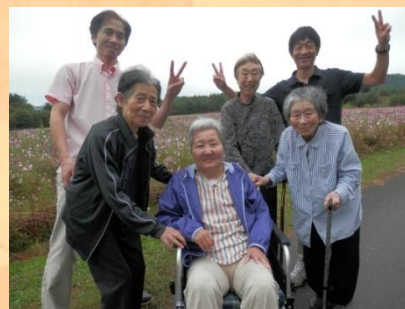
東山ファミリーランドにて