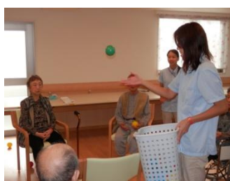
只今カウント中！何個入ったかな？