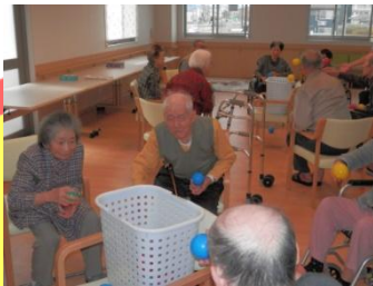
制限時間は1分間！どんどん入れて！