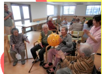
紅白に分かれて競争しました(^_-)☆