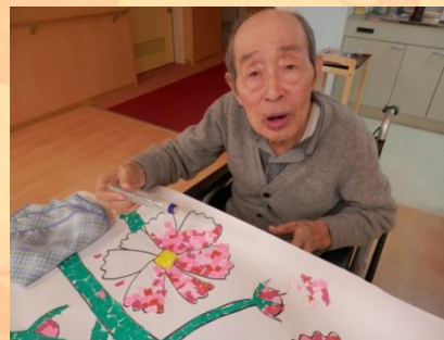
ちぎり絵、製作中です(*^_^*)