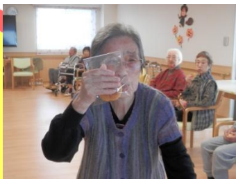
ぱっちり取れました～(^o^)