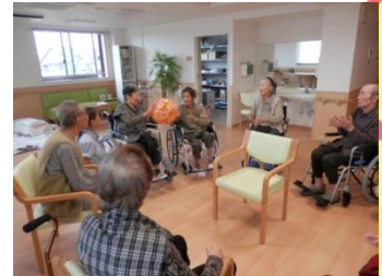
大玉送りは連携プレーです☆シ