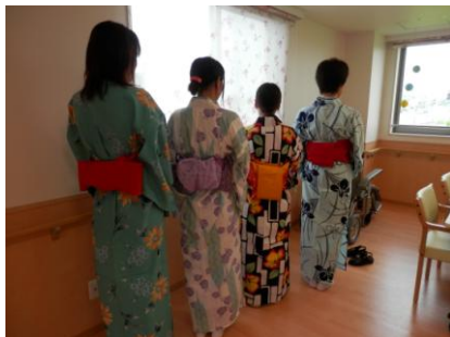
帯もきれいに結べました!!