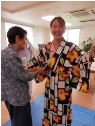
みよ様の見事な着付けにビックリ!!