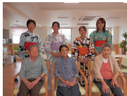
皆で仲良くパチリ!!