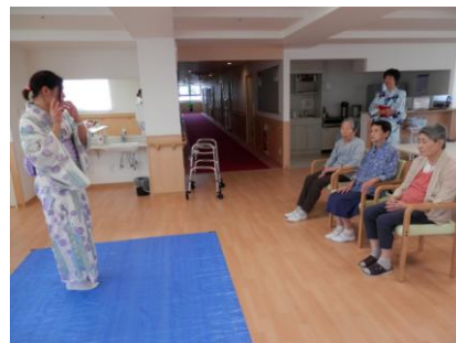
笛の音色に皆様うっとり♪